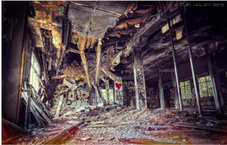
SYDÄMELLISESTI TERVETULOJA

hieman pelottavaakin. Tuli paljon onnistuneita otoksia. Kuvausten jälkeen saimme pienen ukkoskuuron niskaamme, joten kuvaamista ja jutustelua jatkettiin Tornin Hotellin Moro Sky baarin kattoterassilla, mistä oli upeat näkymät yli kaupungin.