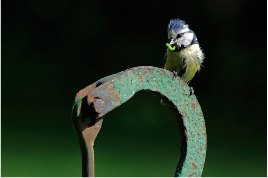
SINITIAISEN KESÄKIIREET