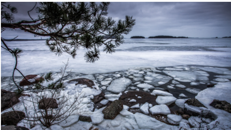
JOLLAksen KEVÄTTÄ