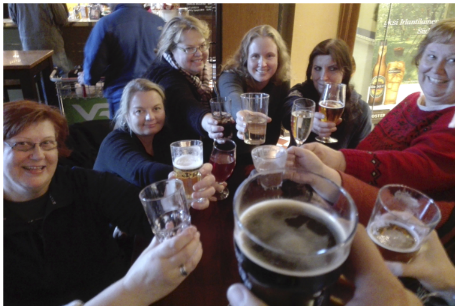
Malja 5-vuotiaalle!