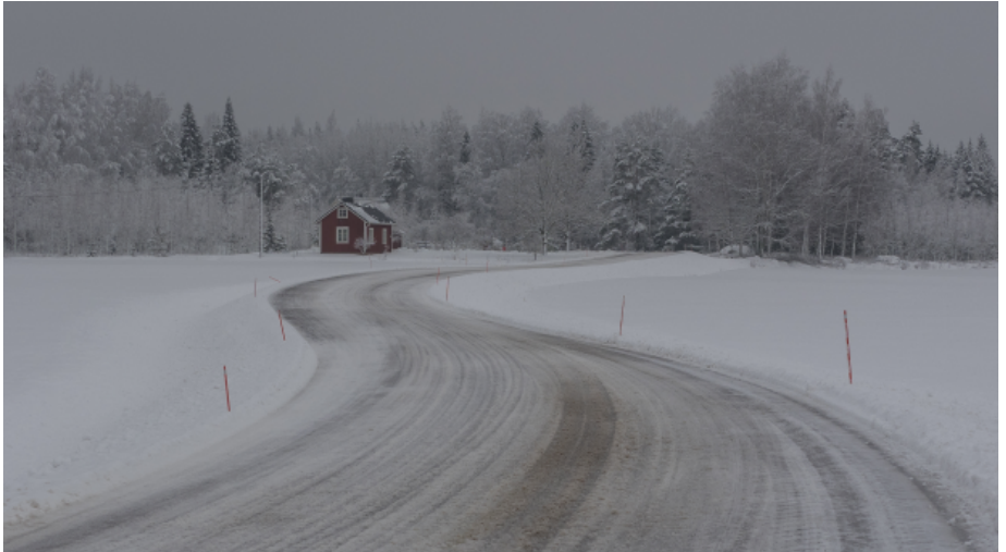
TALVINEN TIE