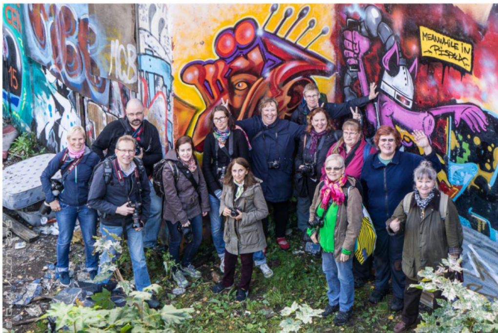
Yhteiskuva mukavien Tampereen valokuvausseuran kuvaajien kanssa.