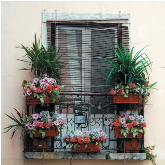
VESA JAKKULA Kukkiva parveke