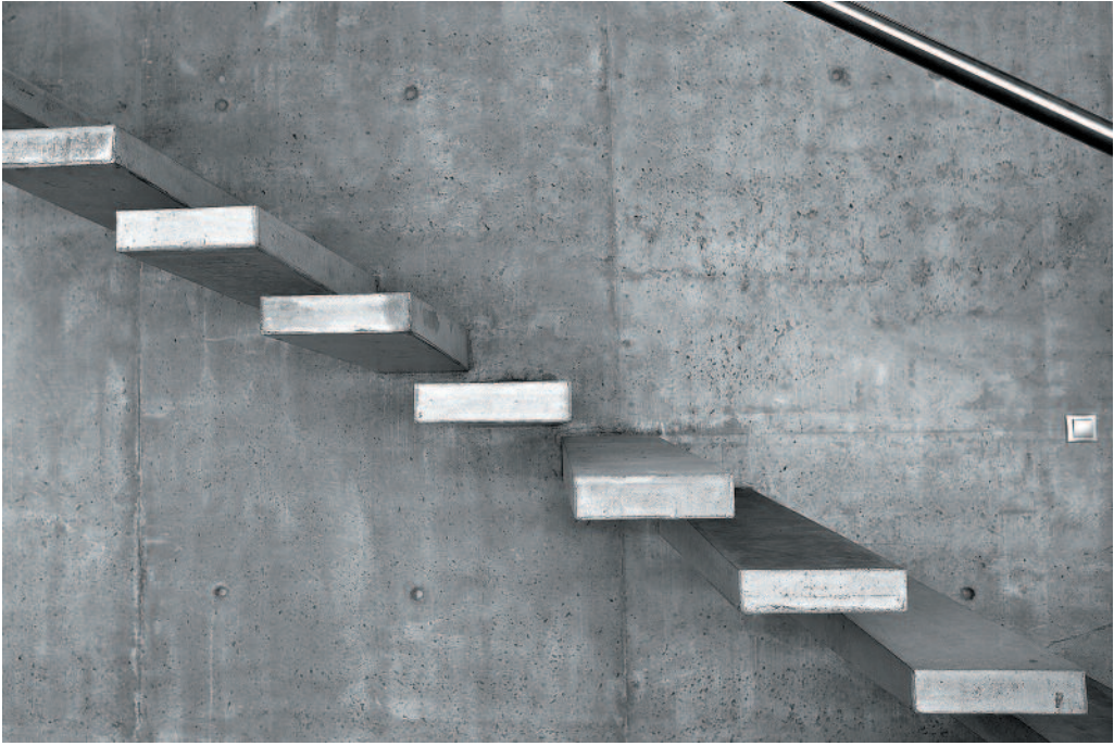
HANNU LEHTO Portaat