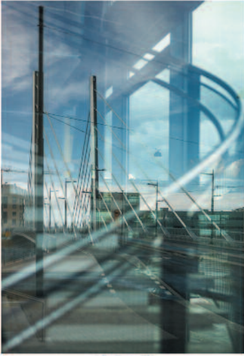
ILPO TÖRNQVIST Sinivihreä3