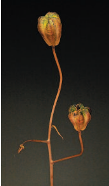
HENRI JALO Siemenkodat

Kokoukset ovat kuukauden 4. tiistai klo 18.00 Kameraseurassa.