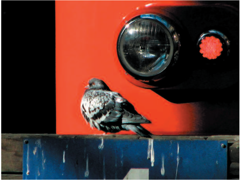
TUULA ROOS Assan pulu