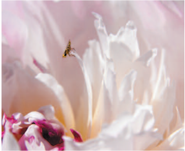
JUSSI JYVÄLAHTI Kaksi ja puoli volttia eteenpäin kieren

Tässä onkin loistava mahdollisuus päästä kuuntelemaan, mitä mieltä huiput ovat sinun kuvistasi! Kilpailut ovat paperivedoksille, dioille ja kuvatiedostoille, kolme parasta palkitaan samanarvoisina.