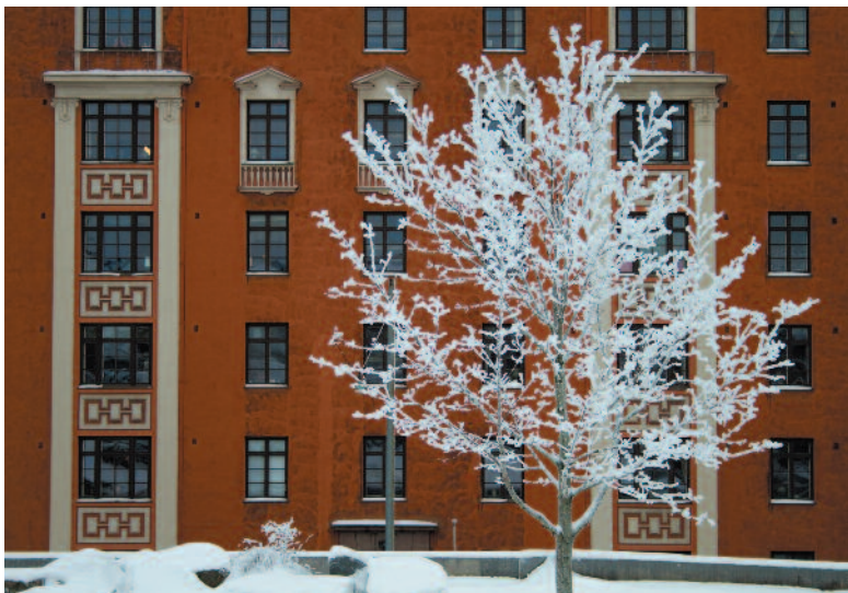
AIJA LEHTONEN Huurrepuu

tus; kuva voi olla ns. ruma tai ärsyttäväkin kunhan katsojan mielenkiinto saadaan heräämään. Orjuuttavia sommittelusääntöjä Eero inhoaa. Ilta kului Eeron seurassa rattoisasti ja lopuksi Eero arvosteli tulo- lokasuokan kilpailun kuvat.