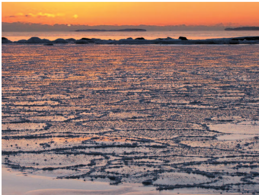
GUNTA KRUMINA Painting by winter. Orange